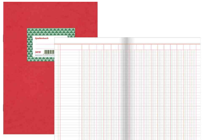
Spaltenbuch, 16 Spalten