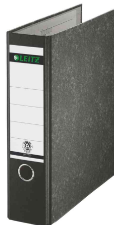
180° Wolkenmarmor-Ordner, 80 mm