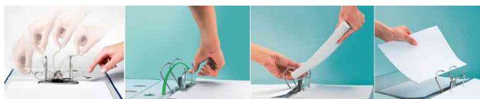
Hebel um 180° umlegen - große Mengen auf einmal ablegen - auch links einlegen